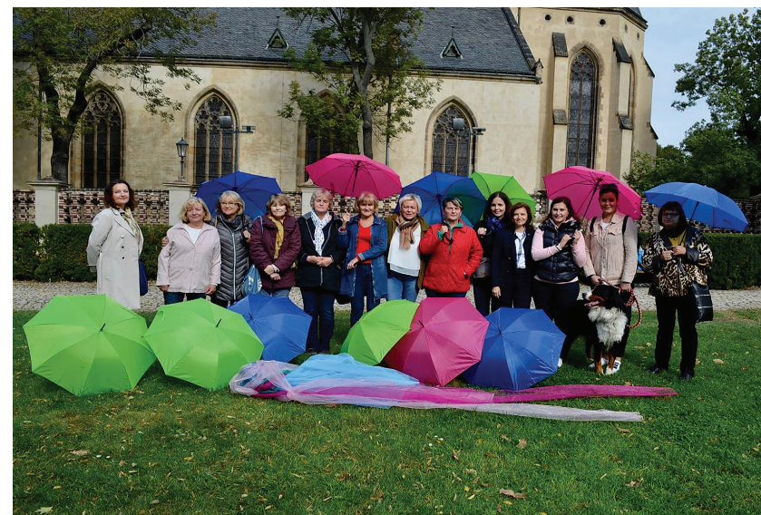
Happening k Mezinárodnímu dni metastatické rakoviny (11. 10.)