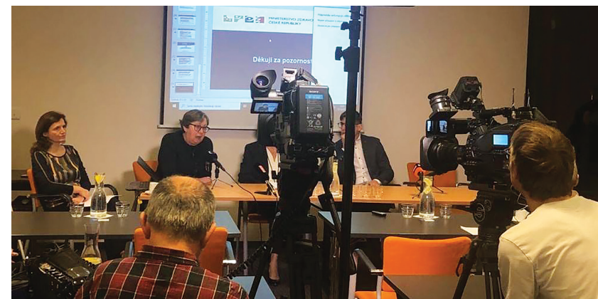
Tisková konference HOP k tématu prevence onkologických onemocnění (12. 12.)

Grant od společnosti Novartis, s.r.o., na částku 300 000 Kč.