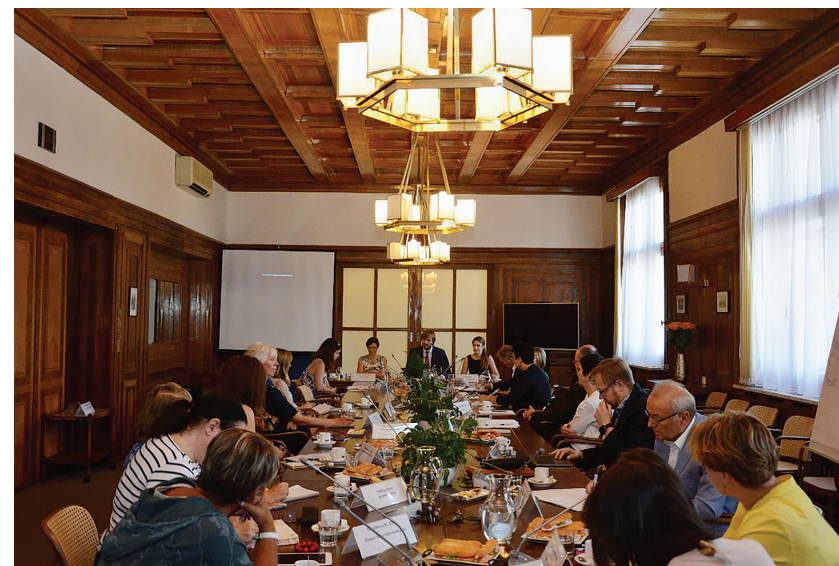
Kulatý stůl na ministerstvu zdravotnictví za účasti ministra (28. 6.)

Zástupci HOP ve spolupráci s MZ ČR uspořádali s představiteli MZ v čele s ministrem Adamem Vojtěchem kulatý stůl na téma zdravotních potřeb onkologických pacientů. Účastni byli také zástupci odborných lékařských společností, zdravotních pojišťoven a další odborníci.